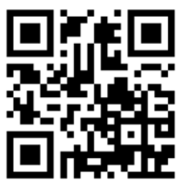
네이버 밴드 '바라미'